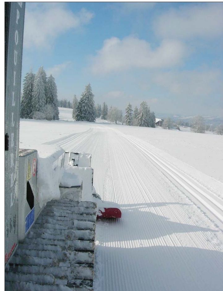
POUILLEREL Les pistes sont préparées depuis mercredi. Après la machine, le balisage se fait skis aux pieds.

La vague hivernale a du bon pour les amateurs de ski, que ce soit de fond et même de piste. Le télésiège du Chapeau-Râblé a ouvert jeudi soir pour une première nocturne intrépide. «La piste est damée. Le fond est mince, mais agréable», résume l'exploitant Sully Sandoz. Ouverture pour le week-end ce matin à 9 heures.