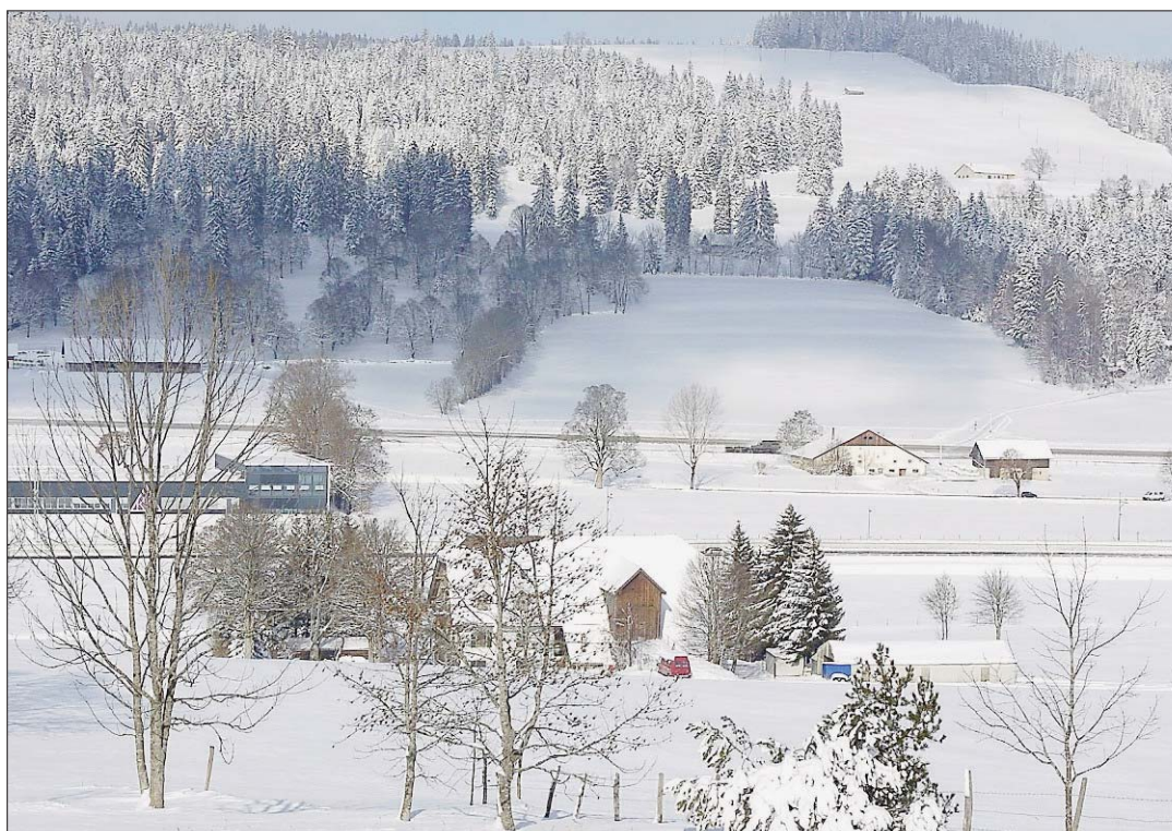
GOLDEN GREEN VALLEY La manufacture Patek Philippe a acquis au Crêt-du-Locele un terrain de 18 000 m2 situé entre Neode et Cartier. Première étape, une construction est prévue sur deux niveaux.